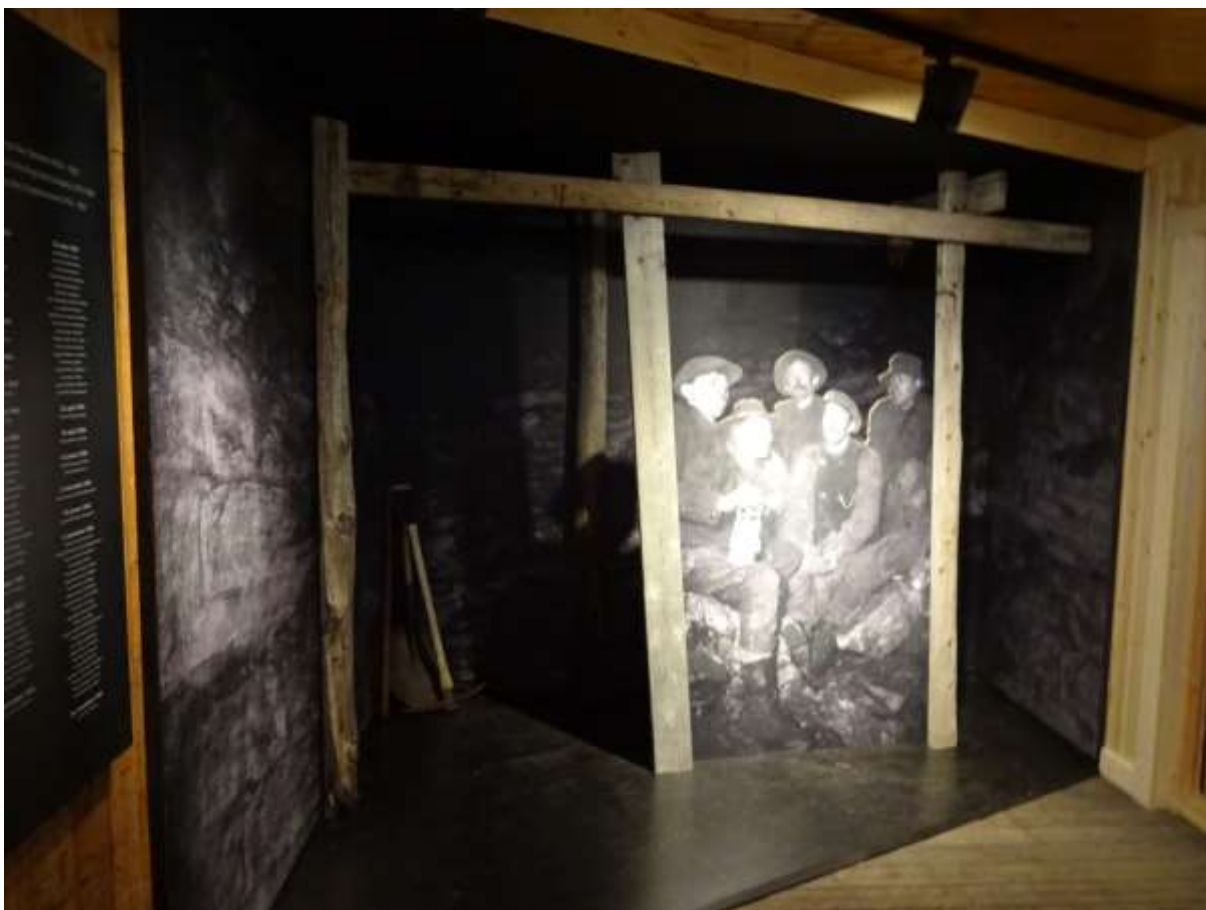
Figur 5 Museets "selfie corner" i foajeen.

Fra dette rommet ledes besøkende inn i selve utstillingen mot venstre (sør) der gruvehistorien er organisert kronologisk. Dette rommet er delt på langs av plansjer med bilder og informasjon. Nederst i rommet har vi satt fokus på dagligliv, men også de mange ulykkene som rammet Ny-Ålesund. Resten av utstillingen omhandler den første forskningen i Ny-Ålesund. Vi har også fått plass til et lite rom der det skal vises filmer (uten lyd) kontinuerlig. Filmene er framskaffet av Per Kyrre Reymert og er fra 50- og 60-tallet. I tillegg er det i denne delen av utstillingen et rom der livet i Ny-Ålesund i dag presenteres. Fra den historiske utstillingen kan man gå videre til Informasjonssenteret. Selve informasjonssenteret er uendret fra tidligere.