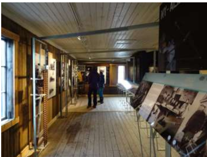
Figur 6 Fra foajeen går man mot inngangen til venstre. Her følger gruvehistorien kronologisk.

Fra dette rommet ledes besøkende inn i selve utstillingen mot venstre (sør) der gruvehistorien er organisert kronologisk. Dette rommet er delt på langs av plansjer med bilder og informasjon. Nederst i rommet har vi satt fokus på dagligliv, men også de mange ulykkene som rammet Ny-Ålesund. Resten av utstillingen omhandler den første forskningen i Ny-Ålesund. Vi har også fått plass til et lite rom der det skal vises filmer (uten lyd) kontinuerlig. Filmene er framskaffet av Per Kyrre Reymert og er fra 50- og 60-tallet. I tillegg er det i denne delen av utstillingen et rom der livet i Ny-Ålesund i dag presenteres. Fra den historiske utstillingen kan man gå videre til Informasjonssenteret. Selve informasjonssenteret er uendret fra tidligere.