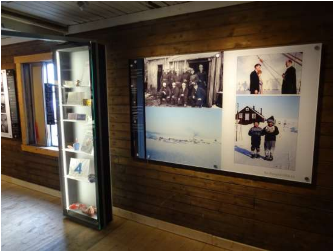
Figur 7 Noen gjenstander fra livet i Ny-Ålesund har det også blitt plass til.