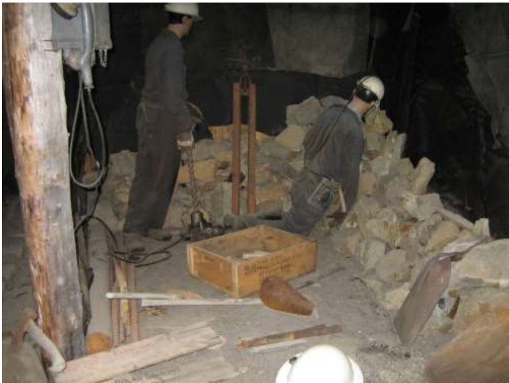
Figur 3 Gjenstander og utstillingselementer hadde stort behov for fornying.