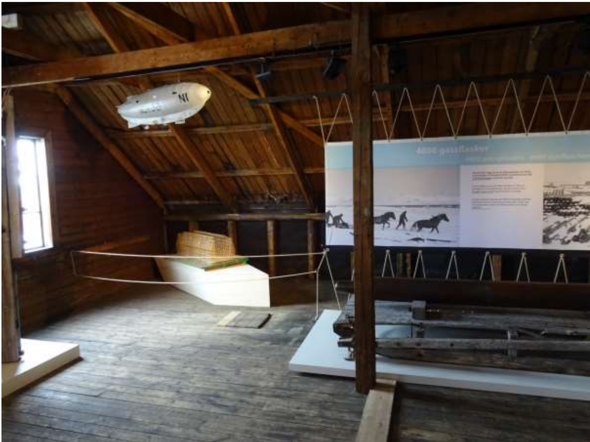
Figur 9 Modell av luftskiphangar og luftskipet "Norge" på loftet på Museet.