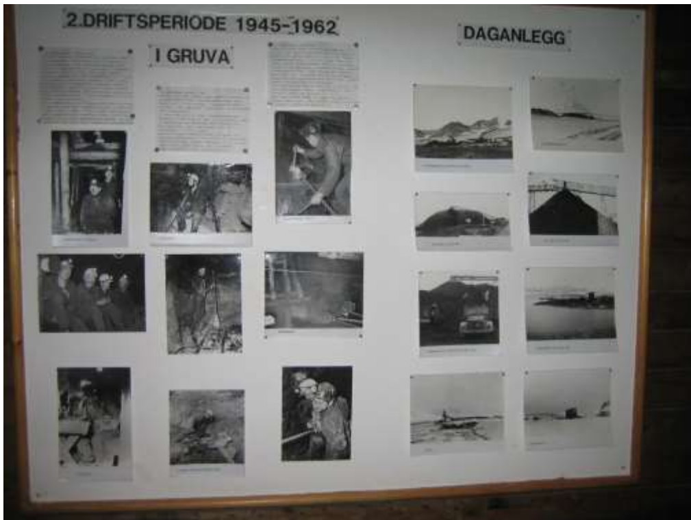
Figur 2 Bildet viser plansjene i den gamle utstillinga. Gjennom årene hadde disse blitt veldig slitt.

Den historiske utstillingen var gjennom årene blitt veldig slitt, og det var på tide med en fornying. Ønsket fra Kings Bay var at de to utstillingene i bygget kunne ses i sammenheng, og at det ble åpnet opp mellom utstillingene. Tidligere måtte man ut og inn en annen inngang for å se begge utstillingene.