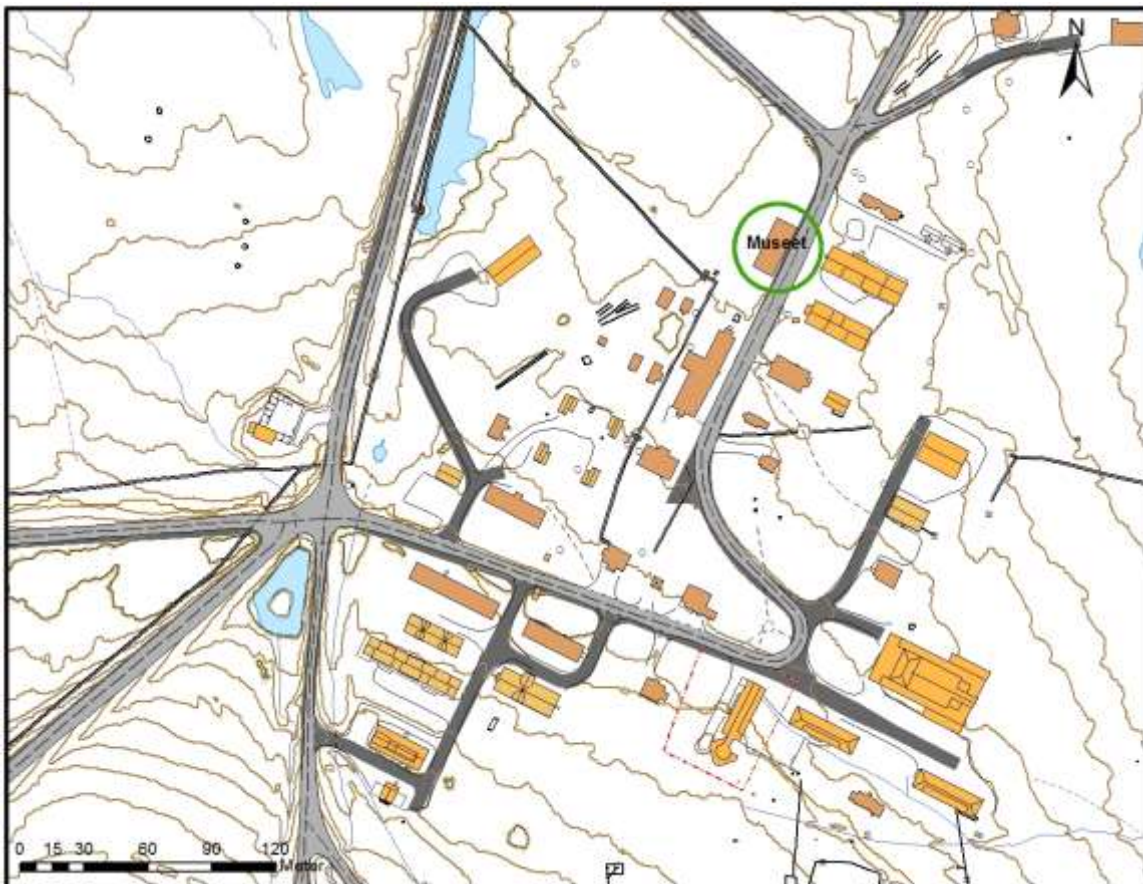
Figur 1 Kartet viser beliggenheten til Museet.

På 1980-tallet ble deler av bygget som tidligere huset butikken i Ny-Ålesund gjort om til museum, med fokus på gruvehistorien i Ny-Ålesund. I 2008 ble det i resten av 1. etasje i bygget installert et informasjonssenter, der forskningen i Ny-Ålesund ble presentert. De to utstillingene hadde hver sin inngang, og det var ingen sammenheng mellom dem.