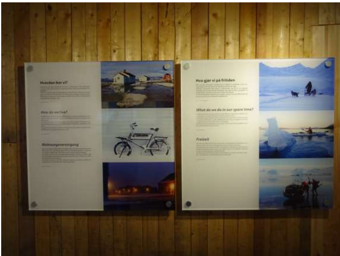
Figur 8 I ett av smårommene i 1. etasje presenteres livet i Ny-Ålesund i dag.