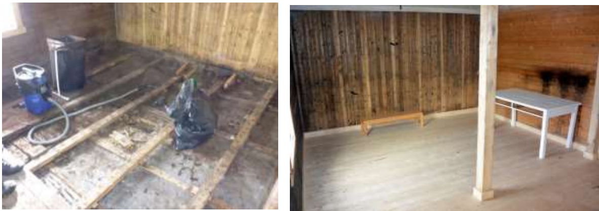
Figur 4 Gulvet i sørenden av Museet hadde råteskader i bærelaget . Dette ble rettet opp, og nytt gulv lagt oppå.

I det tidligere kontoret, ble veggplater av nyere dato fjernet. Både her og i rommet ved inngangen, dukket det opp originalt, smalt panel under den nyere overflaten.