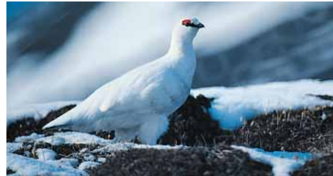
Svalbardrypa er den eneste landlevende fuglen som holder til på øygruppen året rundt.

Det er tillatt å ta med seg inntil fem kilo viltkjøtt per person fra Svalbard til fastlandet.