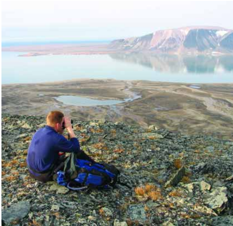
Svalbards natur byr på store opplevelser. Her nytes utsikten fra Rodahlfjellet i Sorgfjorden nord på Spitsbergen.

Svalbardmiljøloven med tilhørende forskrifter er det viktigste miljøregelverket på Svalbard. Dette heftet inneholder informasjon om bestemmelsene i regelverket, samt en del annen informasjon som kan være nyttig når du skal ferdes på Svalbard. Formålet med regelverket er å opprettholde et tilnærmet uberørt miljø på øygruppen. Et overordnet prinsipp er at alle som ferdes på Svalbard skal vise hensyn og opptre varsomt, slik at naturmiljø og kulturminner ikke blir unødig skadet eller forstyrret.